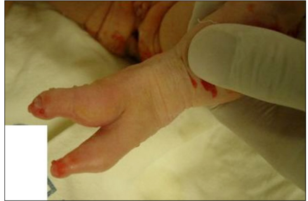
Fig. 3. Lobster-claw shaped anomaly of left foot.

상 소견은 관찰되지 않았다. 그러나, 복부 검사에서는 3×3.5 cm의 복벽 결손을 통해 양막에 덮힌 채 소장의 일부가 탈출되어 있는 이상 소견이 관찰되었다. 이런 이상 소견 외에도 양 옆구리와 등에 다발성 피부결손이 발견되었다. 사지에는 우측 발의 결지 합지증(Ectrosyndactyly)과 좌측 손의 다지증(Polydactyly)이 관찰되었으며, 좌측 족부에는 Goltz 증후군에서 전형적으로 보이는 바닷가재 집게발(lobster-claw shaped) 모양의 변형이 관찰되었다(Fig. 3). 그 외에도 고관절 외전의 이상이 관찰되었다. 피부 조직 생검을 시행하였고 광학현미경상 진피가 위축되고 지방조직으로 대체되어 있어 환아는 제대탈출을 동반한 Goltz 증후군으로 진단되