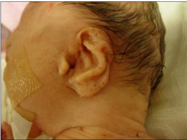
Fig. 2. Abnormal shaped left ear.

상 소견은 관찰되지 않았다. 그러나, 복부 검사에서는 3×3.5 cm의 복벽 결손을 통해 양막에 덮힌 채 소장의 일부가 탈출되어 있는 이상 소견이 관찰되었다. 이런 이상 소견 외에도 양 옆구리와 등에 다발성 피부결손이 발견되었다. 사지에는 우측 발의 결지 합지증(Ectrosyndactyly)과 좌측 손의 다지증(Polydactyly)이 관찰되었으며, 좌측 족부에는 Goltz 증후군에서 전형적으로 보이는 바닷가재 집게발(lobster-claw shaped) 모양의 변형이 관찰되었다(Fig. 3). 그 외에도 고관절 외전의 이상이 관찰되었다. 피부 조직 생검을 시행하였고 광학현미경상 진피가 위축되고 지방조직으로 대체되어 있어 환아는 제대탈출을 동반한 Goltz 증후군으로 진단되