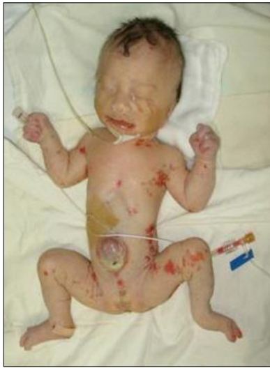
Fig. 1. Omphalocele and multiple macular erythematous skin lesions in anterior and lateral aspect of trunk, both upper and lower extremities.