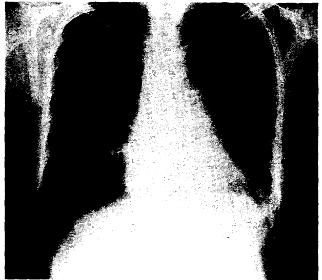
Fig. 4. Postoperative Chest PA at POD # 21st. day.

제거할때 살피본 바 출혈은 woozing 이었고 heparin 사용을 중단한 후에 멈추었다. 중환자실에서 상처를 봉합할 때 종격동 조직 및 혈액의 균 배양 검사를 시행하였는데 결과는 모두 음성이었다. 그 후 환자는 아무런 문제점 없이 계속적인 회복을 보여 수술 후 4일째 오전에 기도 삽관을 제거하고 오후에 대동맥내 풍선 펌프를 제거하였으며 수술 후 6일째 모든 강심제 사용을 중단하였고 7일째에 일반병실로 옮겼다. 항응고제 투여량을 조절한 후, 수술 후 21일째 퇴원하였다. 심장의 기능도 뚜렷한 향상을 보여, 수술 후 5일째 심초음파상 심박출 계수가 21%였으나(Fig. 2) 6일째에는 29%로 증가하였고 13일째는 45%, 퇴원 당일 시행한 검사에서는