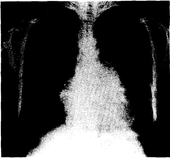
Fig. 1. Preoperative Chest PA. There shows double contour of right cardiac border and straightening of left cardiac border suggesting left atrial enlargement. Lung markings of both lower lung fields are increased.

는 내원당시 문진상 전신 무력감, 열감, 흉통, 기침, 가래, 안정시의 가벼운 호흡곤란 및 운동 시의 심한 호흡곤란 등을 호소하였으며 이학적 소견상 혈압은 110/80 mmHg, 맥박은 80 회/min., 호흡수는 18 회/min.였으며 외견상 만성 병색을 띄고 있었고 영양 상태는 보통 정도였다. 청진 소견상 호흡음은 양쪽 폐야에서 잘 들리고 있었으며 호흡 시의 잡음은 들리지 않았고, 심장 최대 박동점은 쇄골 정중선과 5번째 늑간이 만나는 곳에서 느껴졌으며 심첨부에서 4도의 수축기 심잡음이 들리고 있었다. 촉진상 복부는 부드러웠으며 간은 만져지지 않았다. 내원 당시 시행한 말초 혈액 검사 및 전해질, 혈청 화학 검사는 모두 정상이었으며 단순 흉부 X선 검사상 양측 폐야의 혈관 음영이 증가 되어 있었고 심장의 우측 경계에 이중 윤곽이 보여 좌심방이 커져 있음을 나타내고 있었다(Fig. 1). 심전도상에는 정상적인 동성 리듬을 나타내었으며 좌심방 비대 및 심장의 우향성을 나타내었다. 환자는 경흉부 심장 초음파검사를 시행하였는데 4도의 승모판 폐쇄 부전, 중등도의 승모판 협착증, 1도의 삼첨판 폐쇄 부전 및 승모판의 석회화와 섬유성 비후, 좌심방의 비대 소견을 나타내었으며 좌심방의 크기는 61 mm로 커져 있었고 승모판의 넓이는 1.2 cm 2 으로 좁아져 있었다. 좌심실은 수축기능에 이상 소견 없었고 좌심실의 심장 박출 계수는 71%였다. 심도자 검사상에서는 폐모세혈관압 25 mmHg, 폐